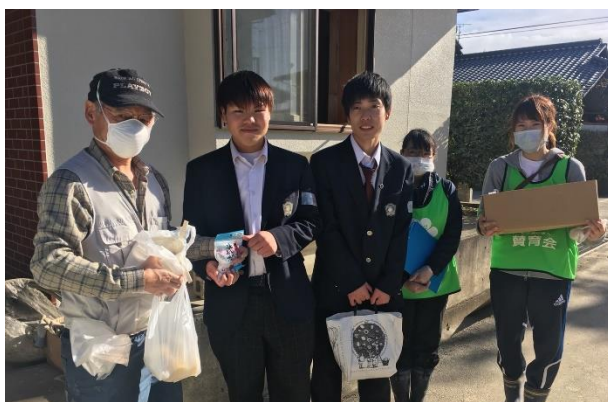
中日本氷糖様の氷砂糖を地元高校生が手渡し

RSYは被災地域との仲介役として、人・モノ・金をつなぐ支援を行っている。スタッフを継続的に派遣し、地元の自治会やボランティア団体、社会福祉協議会や行政などと丁寧に関わることで、企業のCSRや個人、ボランティア団体のお申し出を、被災地にタイムリーにおつなぎすることができる。被災地の復興を願う多くの方々の想いをこれからも現地に届け続ける。