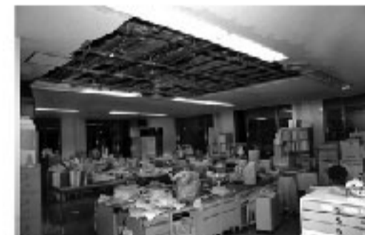
漏水と停電で本庁舎利用できず