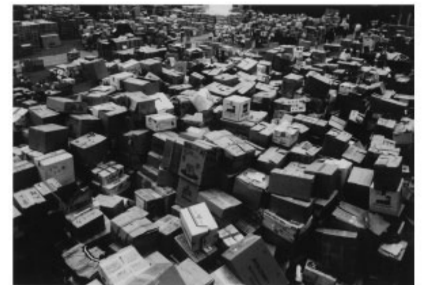
大量の物資。仕分けどころの話ではなかった

る側も受け取る側も、ほとんどがはじめての経験だったといっても過言ではないだろう。いずれにしても善意には違いないとしても、何より興味深いのは、被災者の多くは「モノよりお金」が必要だったと振り返っていることである。