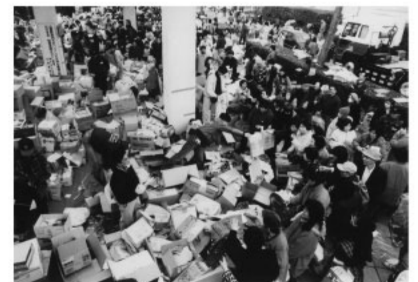
配布の様子。これでは強い者しか受け取れない