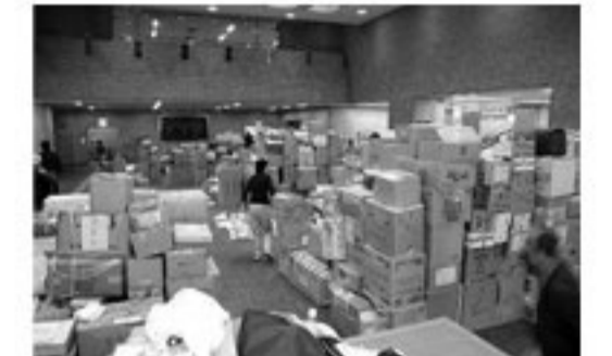
救援物資でいっぱいになる市役所1Fホール