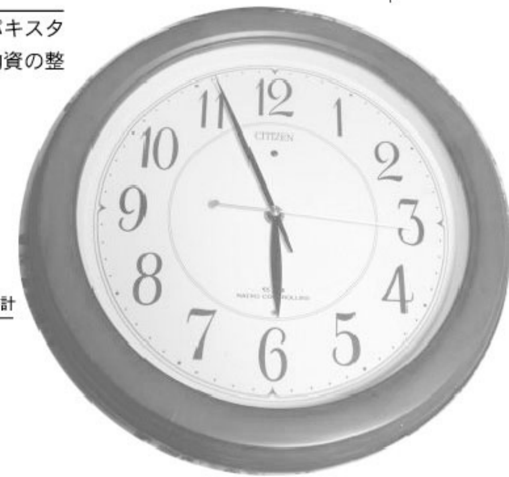
地震で止まった時計