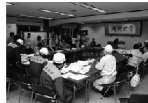
発災当初、消防本部3F講堂に設置された災対本部