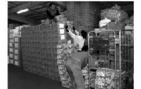
次々運び込まれる物資