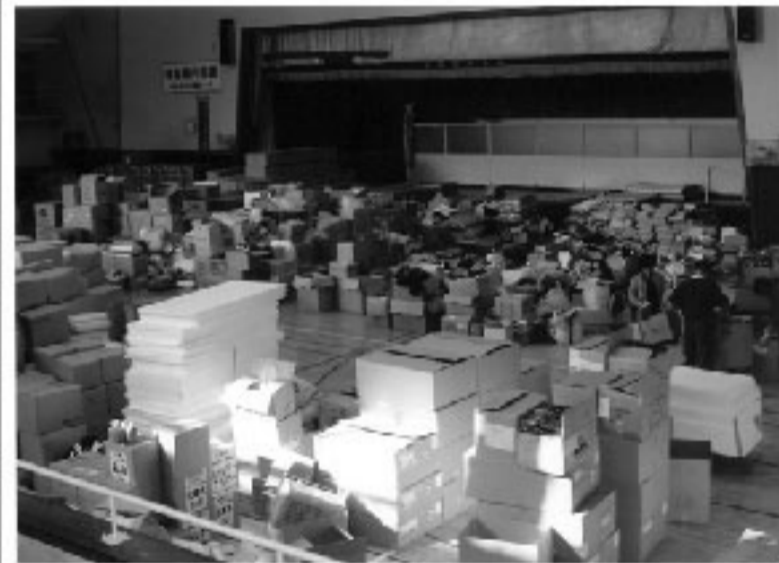
救援物資の集積状況

何度も物資を取りにくる反面、物資が手元に届かない被災者が不公平感を募らせたりした。また、刻々変化するニーズとずれて到着し、使い道のないものもたくさんあった。それらは結局被災2ヵ月後にチャリティーバザーで処分せざるをえなかった。収益は80万円になったが、色々な意味でもったいないことだった。