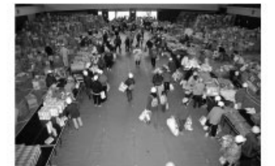
地震から1ヶ月経って配布される物資